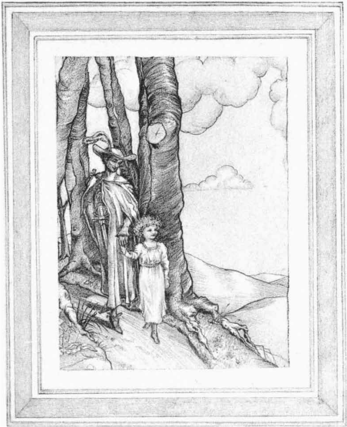
Wie Sir Ywain von einem Kind hinfort geführt wurde.